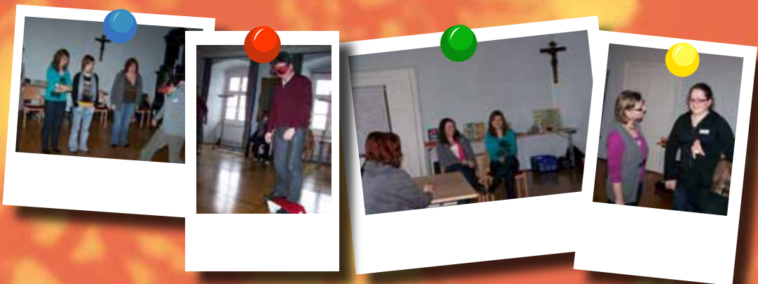
GruppenleiterInnenschulung in Reichersberg