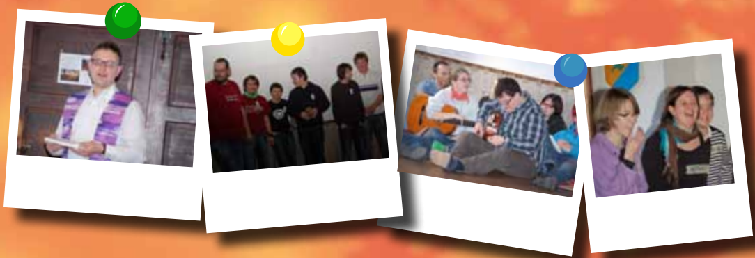
Jugendgruppenimpulstreffen auf der Burg Altpernstein