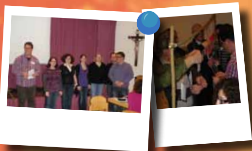
Dekanatsteam Schärding stellt sich beim Dekanatsrat vor