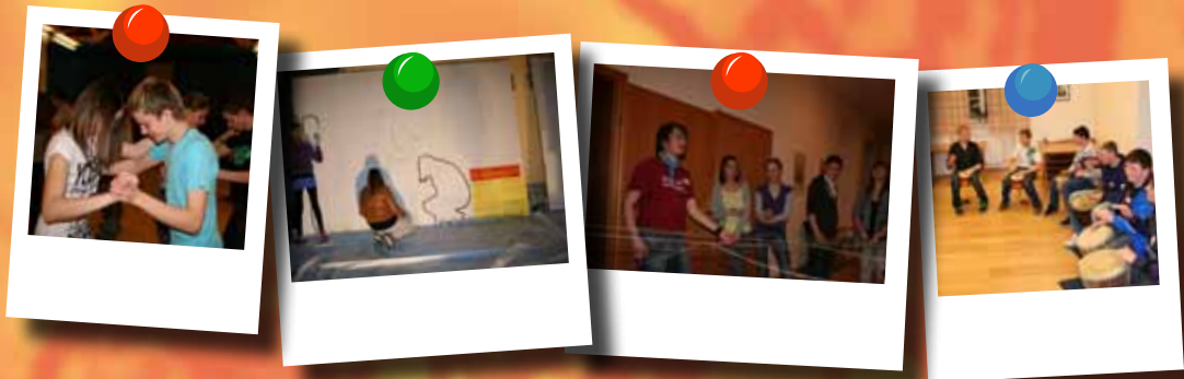
Nightline - die lange Nacht der Jugend in Schärding